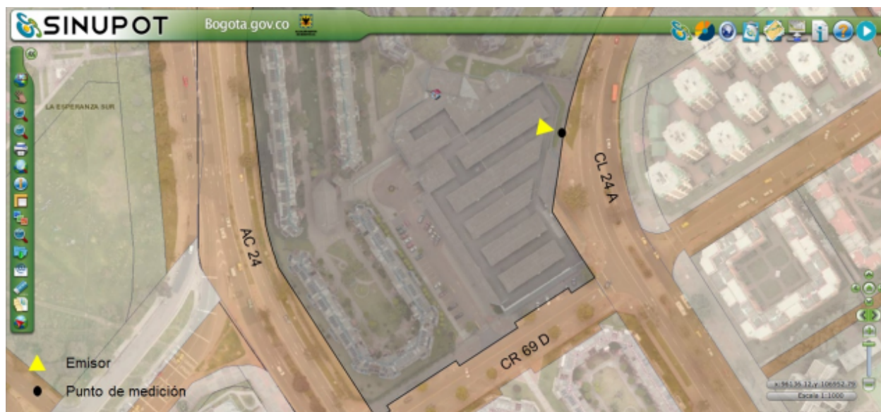
Figura No. 1. Ubicación del predio emisor y punto de medición.